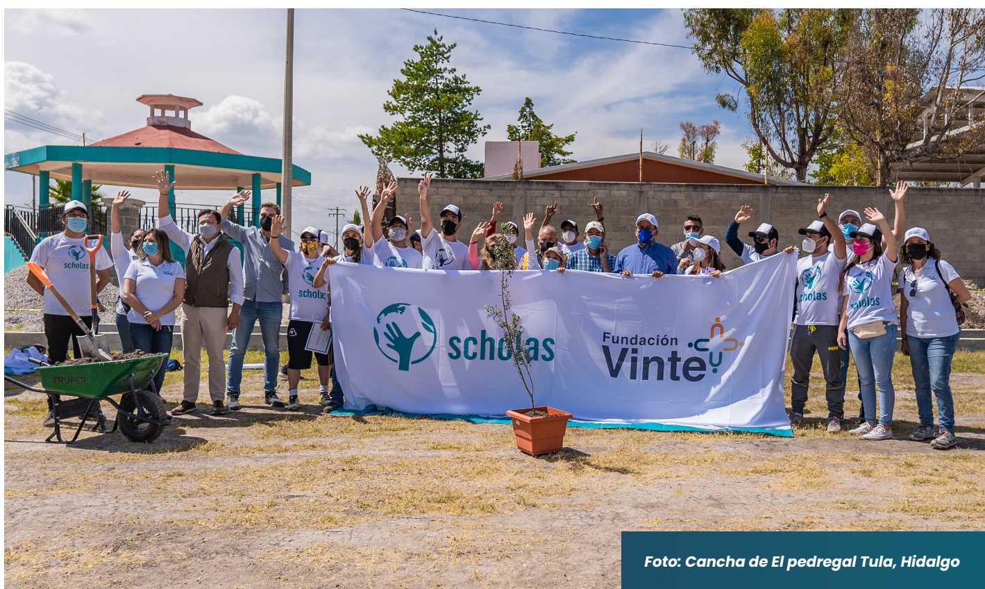
Foto: Cancha de El pedregal Tula, Hidalgo